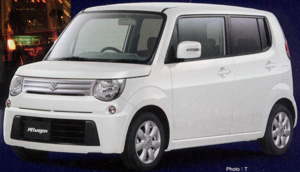
Photo: T ボディカラーはパールホワイト